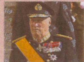
Koning Harald van Noorwegen

Het is de datum van de moordpartij die het leven kostte aan 77 mensen op het eiland Utøya en in Oslo. Terwijl hij de afschrikwekkende aanslagen niet nader benoemde, wijdde koning Harald er het grootste deel van zijn rede aan.