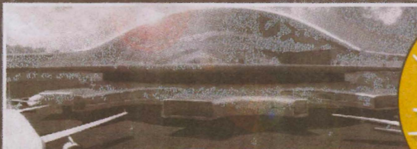
Terminals van de toekomst krijgen futuristische ontwerpen met ruimte voor efficiency en duurzaamheid. Lange wachttijden moeten tot het verleden gaan behoren. De nieuwe iPort is een realistisch Nederlands project, dat uitgaat van lopende band-aankomsten en -vertrekken op ronddraaiende cirkelgates, vrij naar McDrive. 'Dat levert 50% meer tumarounds op, 40% minder milieubelasting, 40% ruimtebesparing, 85% minder voertuigen, 60% minder personeel en 55% kortere loopafstanden.'

delt. Tassen en kleren leegmaken voor de scans en fouilleren door mensen hoeft dan niet meer. De 'bad guys' worden er gericht uitgepikt.