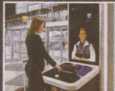
Robotisering is de manier om reizigers op maat te adviseren, in te checken en door te laten stromen. Realtime projecties van medewerkers sparen ook kosten uit.