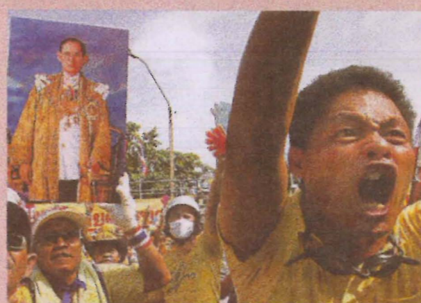
Thaise demonstranten schreeuwen hun ongenoege uit over de regering. Koning Bhumibol dragen ze mee als mascotte.

De Thai zien hun lichamelijke verzwakte koning, die al maanden in het Siriraj Ziekenhuis woont, nog steeds als de bindende factor bij uitstek. In navolging van de premier, diplomaten en andere hoogwaardigheidsbekleders trokken vele Thai naar het paleis om het wensenboek voor de koninklijke familie te tekenen. Uit onderzoek