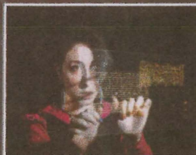
'Virtual en augmented reality' gaan straks op luchthavens de dienst uitmaken. Hierdoor kunnen passagiers veel sneller en intuïtief actuele informatie raadplegen.